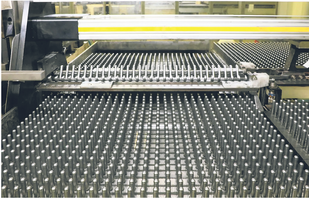
智能化生产线高速运转

本报讯（都匀市融媒体中心 邹元红 高璐）近日，位于都匀经济开发区的贵州广得利医药用品有限公司生产车间内机器轰鸣，智能化生产线高速运转，一粒粒药用空心胶囊从自动化设备中快速产出。