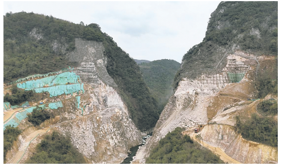
瓮安县塘坎上水库坝肩开挖

本报讯（张元健 杨光新）连日来，在我州各水利工程建设现场，机械轰鸣，工人繁忙而有序。笔者从黔南州水务局获悉，黔南州在建省级重大水利项目、骨干水源工程、中小河流治理工程、重点山洪沟治理工程、规模化供水工程等88项重点水利（水务）工程已于近日全部实现复工复产。