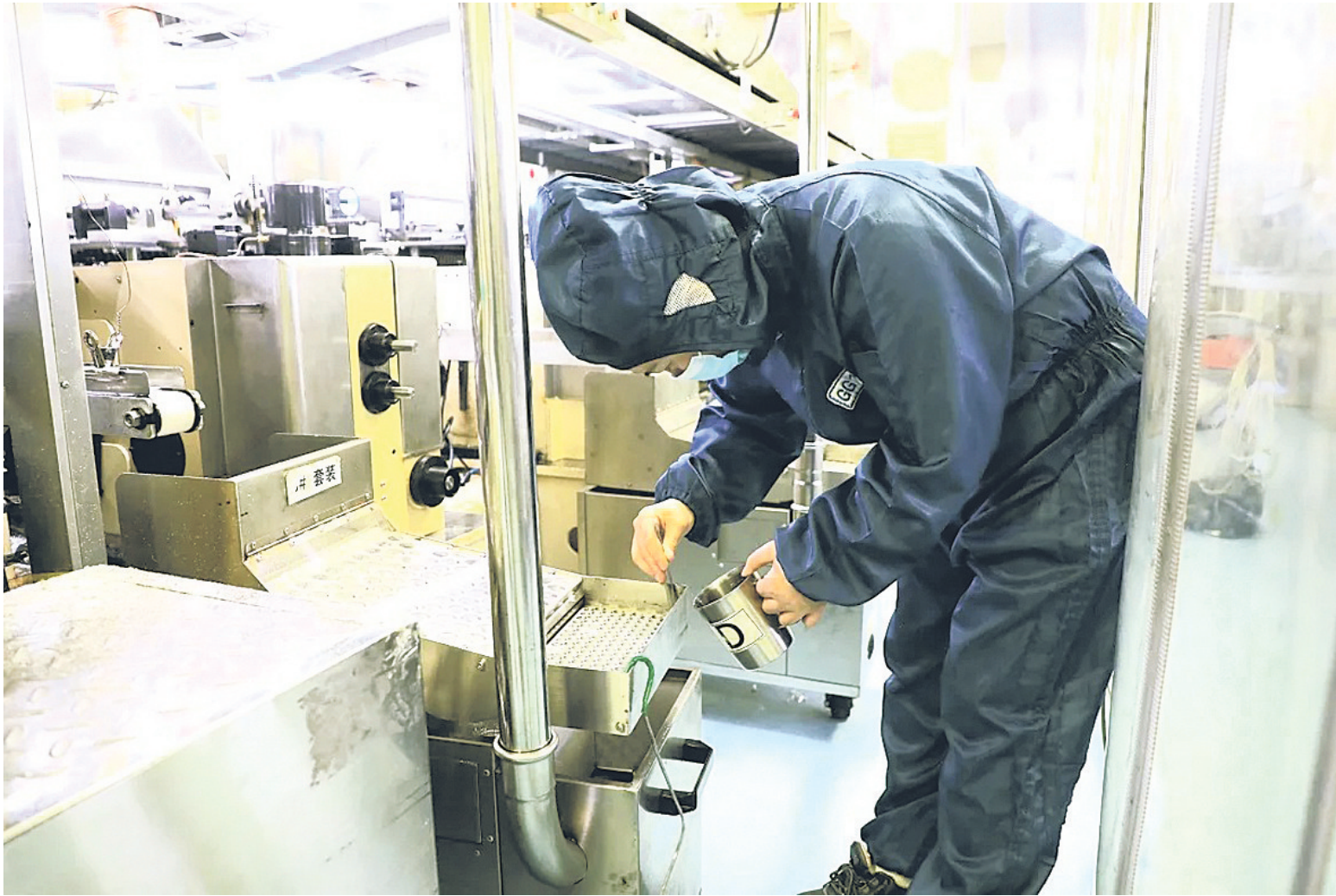
工作人员正在车间内忙碌