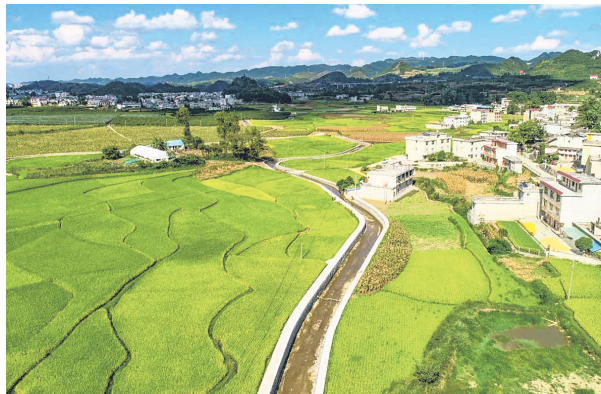
水利建设带动乡村振兴