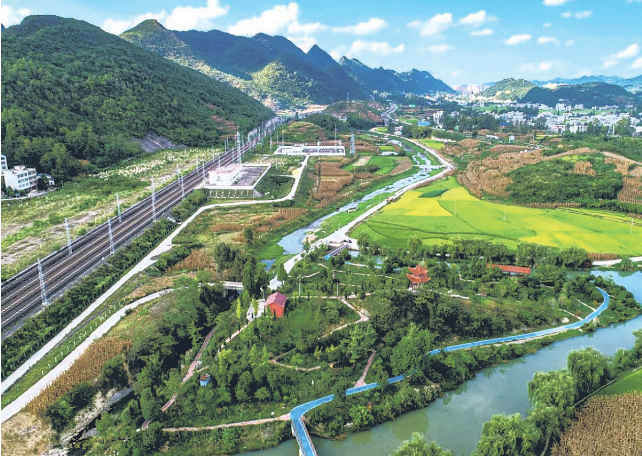
水利建设提升乡村颜值

境，将河岸两边绿化全部进行了公园式打造，极大地增强了周边群众的获得感、幸福感、安全感。