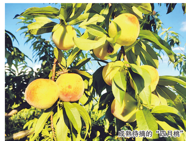
成熟待摘的“四月桃”

本报讯（王懿梓）时下，罗甸县茂井镇桃园新村的“四月桃”迎来丰收季，抢鲜上市。走进桃园新村的“四月桃”种植园，桃树枝繁叶茂，饱满圆润的果实挂满枝头，在绿叶映衬下格外诱人，清新果香裹挟着温热气息扑面而来，果农们穿梭林间，忙着采摘、分拣、装筐、装车，一派繁忙的丰收景象。