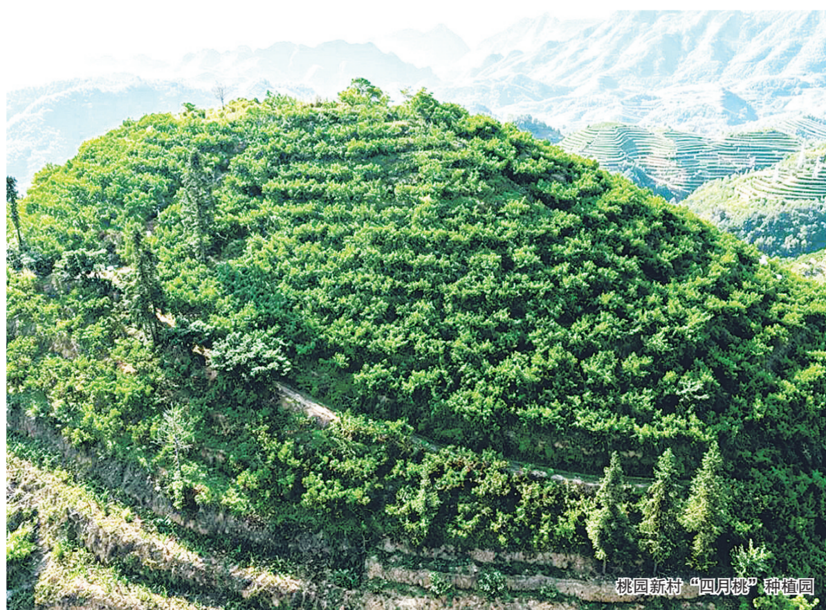
桃园新村“四月桃”种植园