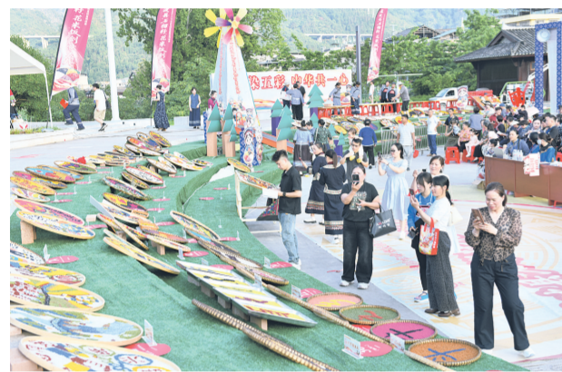
观众在展台前驻足拍照

“四月八”承载着黔南各族群众祭祖祈福、欢庆丰收等深厚文化内涵,是凝聚民族认同的重要载体。本次活动群众参与热情高涨,近50支队伍参赛,每晚观赛群众近千人,充分印证了本土民俗节庆的强大生命力。下一步,黔南州苗学会将持续深耕“四月八”节庆品牌,发挥其在文化传承、民族团结中的重要作用,全力打造具有全国影响力的民族节庆名片。