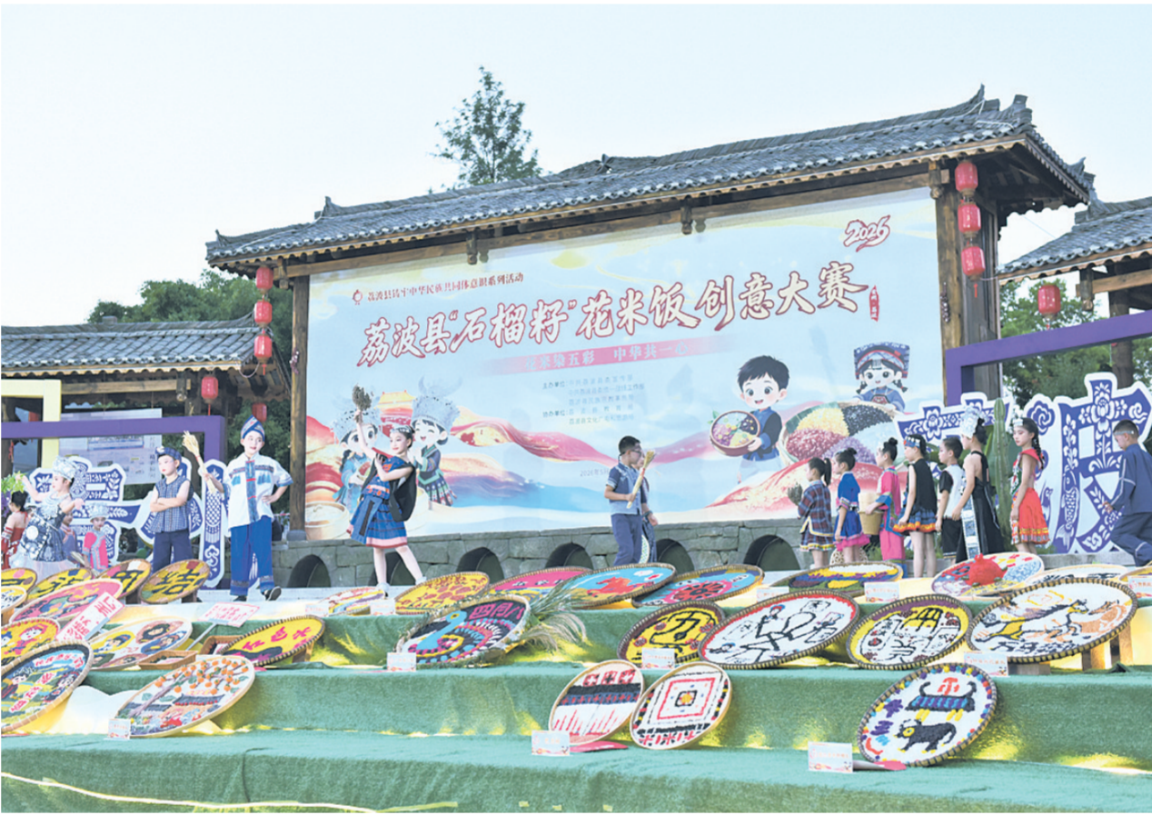
小朋友身着民族服饰走秀

本报讯(荔波县融媒体中心 韦兴盛) 近日,荔波邓恩铭广场首开区人声鼎沸,“花米染五彩 中华共一心”石榴籽花米饭创意大赛热闹开展。来自荔波、三都自治县及广西南丹等地的81支队伍同台比拼,以食传情、以赛促融,在黔南州成立70周年之际,生动展现了荔波深厚的民族文化底蕴与各族群众和睦相融的美好生活景象。