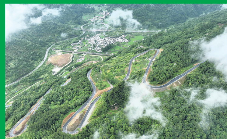
云雾缭绕的都匀市螺蛳壳景区