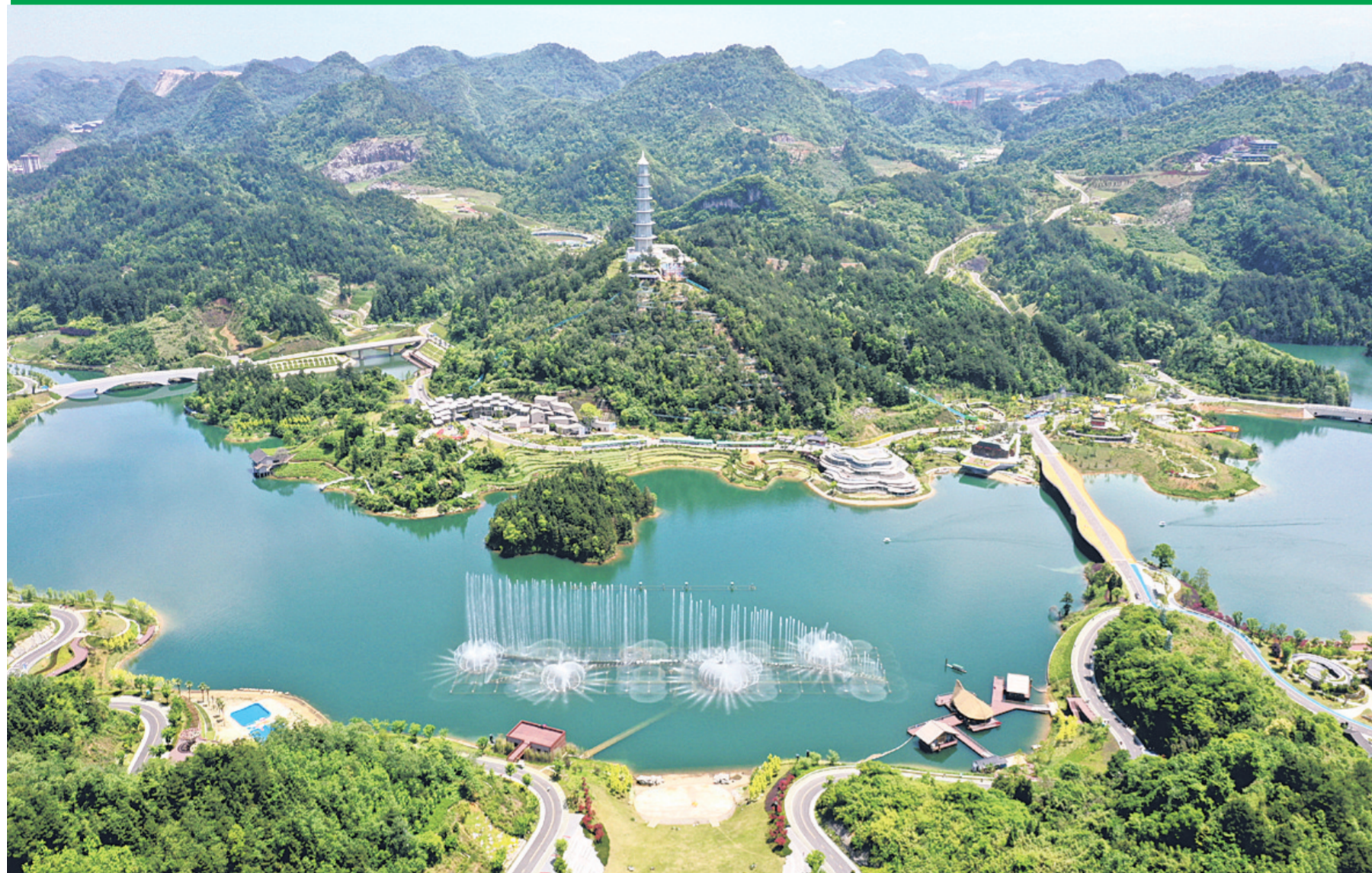
贵州绿博园风景如画

近年来，黔南州深入贯彻落实习近平生态文明思想，坚守发展和生态两条底线，“十四五”以来，全州生态质量稳定保持一类，地表水国省控断面、集中式饮用水水源地、地下水国考点位水质达标率实现三个100%；12县（市）空气质量优良率常年稳定在98%以上，中心城市都匀市PM2.5年均浓度低至16微克/立方米，连续三年空气质量跻身全国前列，2024年获评生态环境部通报表扬。全州森林覆盖率、草原综合植被盖度稳居全省第一方阵，2021—2024年连续四年获评全省生态环境保护工作成效突出市（州），良好的生态环境成为最普惠的民生福祉。