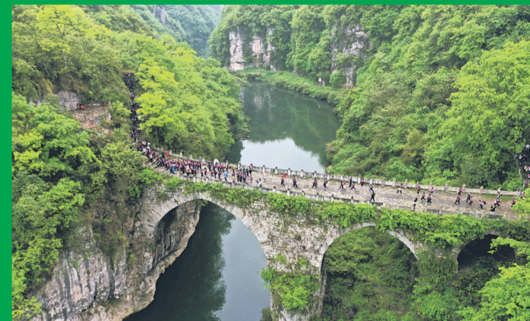
福泉市葛镜桥山清水秀，绿树成荫