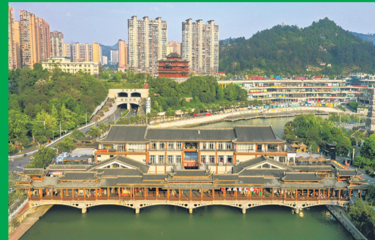
都匀市中心城市环境空气质量常年保持全省前列