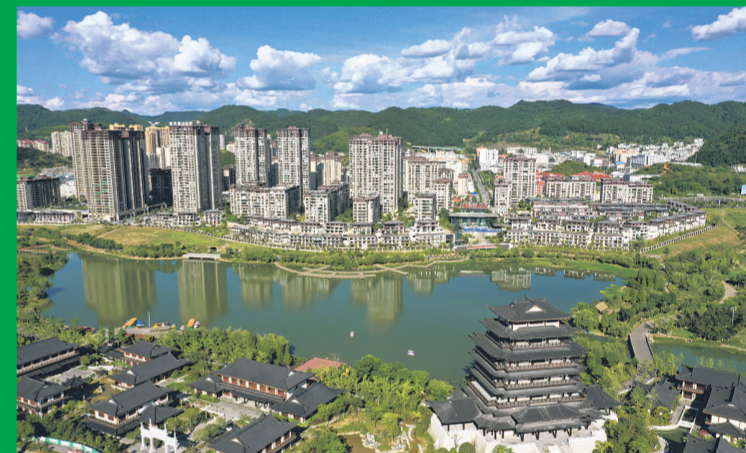
瓮安县清莲湖湿地公园成为市民休闲娱乐的好去处