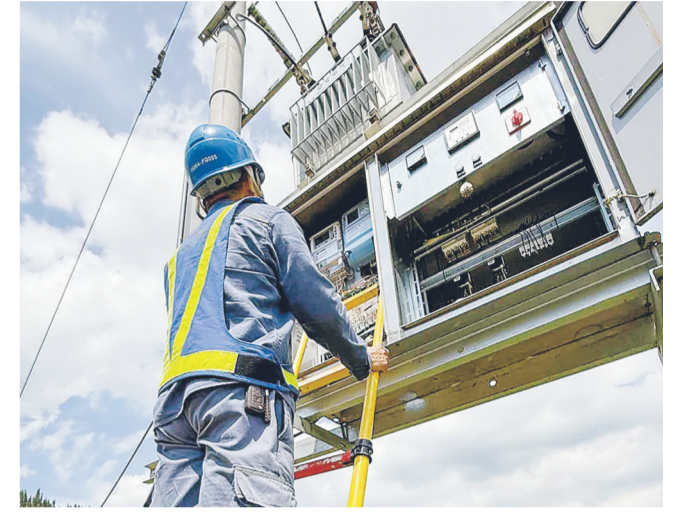
开展全面安全“体检”

本报讯（福泉市融媒体中心 李青）进入汛期以来，福泉市强降雨、闷热潮湿天气频发，辖区电网线路、用电设备受潮等故障风险大幅上升。为有效防范汛期用电安全事故，保障工业生产、政务服务、工矿企业发展用电安全，福泉供电局全面开展雨季专项隐患排查整治行动，全力筑牢汛期供电安全屏障。