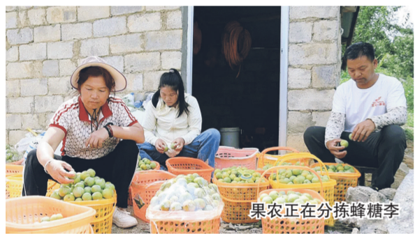
果农正在分拣蜂糖李

本报讯（罗甸县融媒体中心 王冬至 罗骏原）眼下，罗甸县2万余亩蜂糖李迎来丰收。凭借优良的果品品质，省内外客商纷纷前来抢购，大部分果园被收购商“包园”预订，供不应求，实现产销两旺。