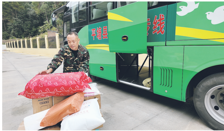
公交司机正在搬货