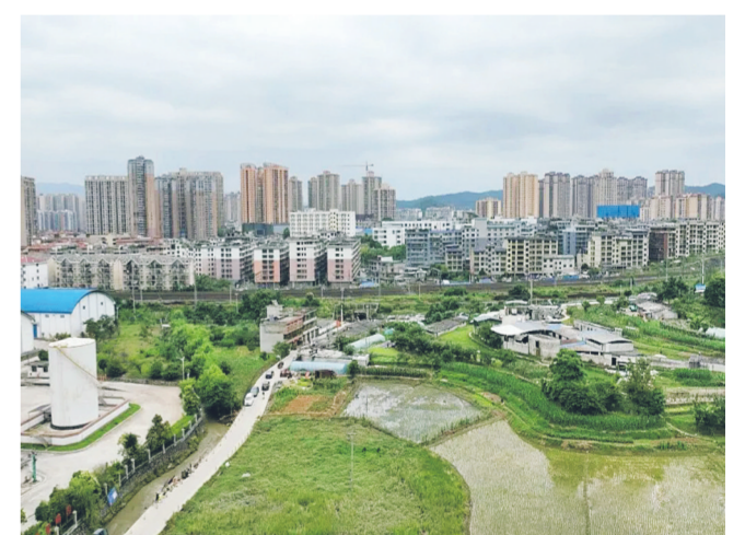
贯城河补水工程项目航拍大景

本报讯（龙里县融媒体中心 王家丽）日前，龙里县贯城河补水工程项目顺利贯通，该项目投入使用后，不仅有效解决了河道季节性缺水的难题，还彻底改善了地表水补给不足、枯水期水量骤减、水体自净能力偏弱等一系列问题。